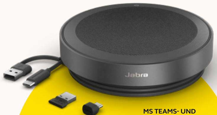
MS TEAMS- UND UC-VARIANTEN

Um unseren Planeten zu schützen, berücksichtigen wir den Aspekt der Nachhaltigkeit in jeder Phase der Produktentwicklung. Deshalb haben wir das Gehäuse der Speak2 75 aus über 33 % nachhaltigen Materialien 3 gefertigt und eine Reihe von Bauteilen integriert, die repariert oder ersetzt werden können. Mehr Nachhaltigkeit bedeutet eine längere Lebensdauer deiner Freisprechlösung – und sorgt für Gespräche in hoher Sprachqualität für dich und dein Team über Jahre hinweg.