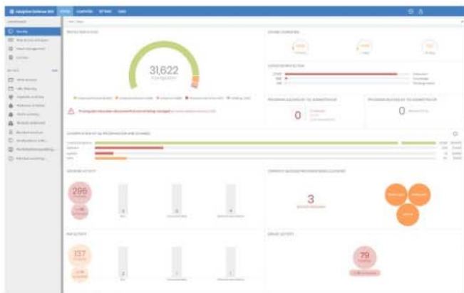
Abbildung 1: Zentrales Dashboard von Panda Adaptive Defense 360