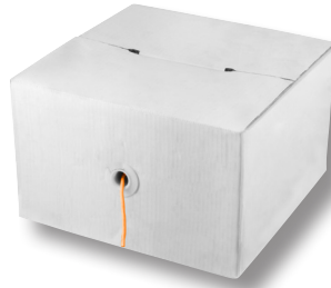
200 m Box