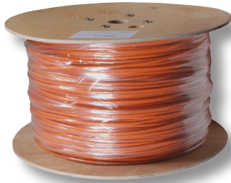
500/1000 m Trommel