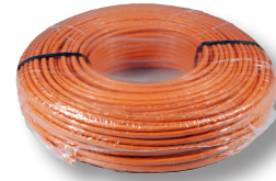
100 m Ring