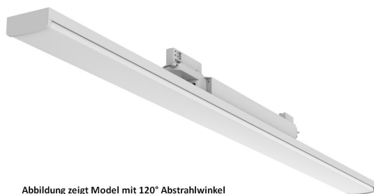
Abbildung zeigt Model mit 120° Abstrahlwinkel