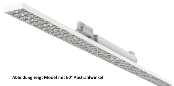
Abbildung zeigt Model mit 60° Abstrahlwinkel