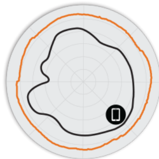
Abbildung 3. R750 5 GHz-Azimet-Antennenmuster