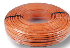
100 m Ring